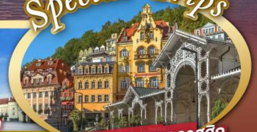
ชมสถาปัตยกรรมคลาสสิก เมือง คาร์โลวี วารี