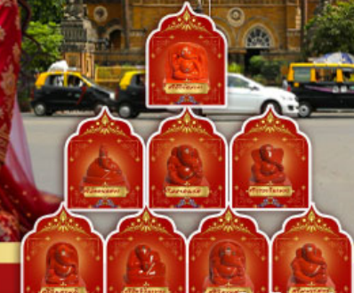
พระพิฆเนศ 8 องค์ เมืองปูณ

" อินเดียครั้งนี้ ไม่ใช่แคร์ิป แต่คือการเปลี่ยนแปลง ปลุกพลังในตัวคุณ... ด้วยพิธีกรรมศักดิ์สิทธิ์ ณ สถานที่จริง ของพระพิฆเนศ ดินแดนแห่งปญญาและพรสูงสุด"