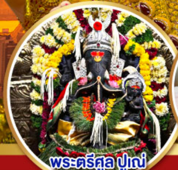
พระตรีศูล ปูณ (Trishul Pune)