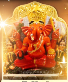
องค์สิทธินายก