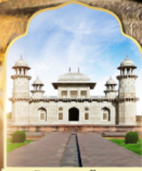
ทัชมาฮาลน้อย