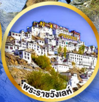
พระราชวังเลห์