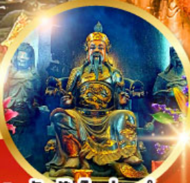
วัดปักโตฮ้องอำ