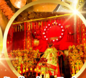
วัดเจ้าแม่กวนอิมฮ้องอำ