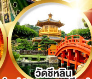
วัดซีหลิน