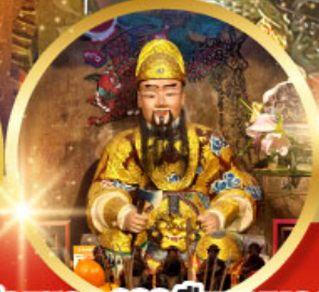
วัดแซกง 600 ปี หุ่นทอง