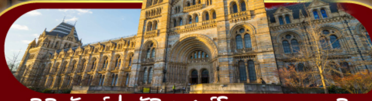
พิพิธภัณฑ์ประวัติศาสตร์โลกทางธรรมชาติ