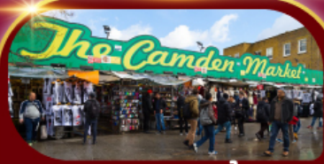
ตลาดแคมเดน