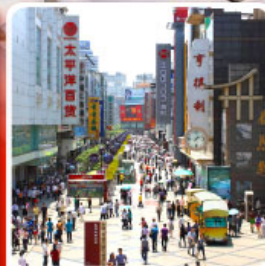
ช้อปปิ้งถนนคนเดินซุนซีลู่