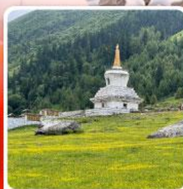
ภูเขาสี่ตรุณี