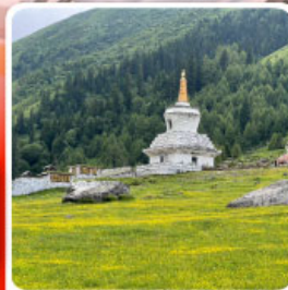
ภูเขาสี่ครุฑ