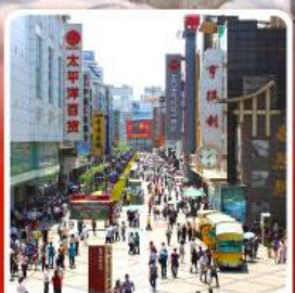
ช้อปปิ้งถนนคนเดินซุนซีลู่