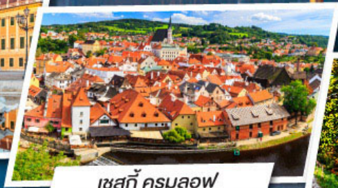
เซสกี ครุมลอฟ