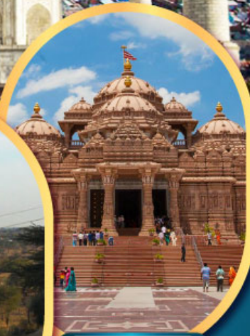
วิหารอักษรัดัม