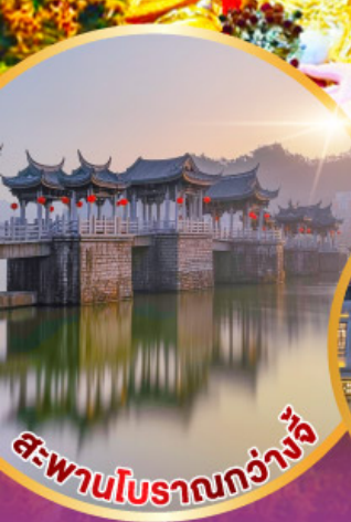
สะพานโบราณกว้างจุ