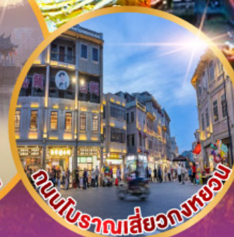
ถนนโบราณสี่วงกทอง