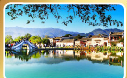
หมู่บ้านผดงโลก หงซุน