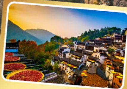
หมู่บ้านหวงหลิง