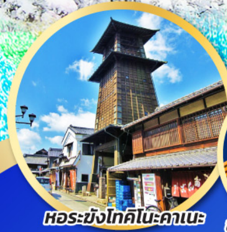
หอรบั้งโทคิโนะคานะ