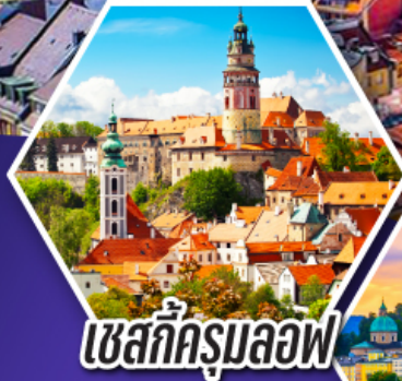
เชสกีครุมลอฟ