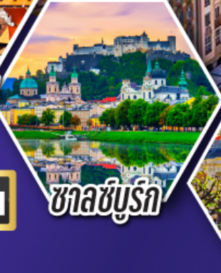
ซาลซบูร์ก