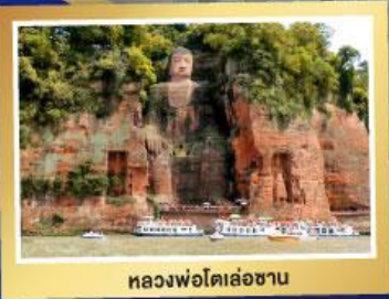
หลวงพ่อโตเล่อซาน