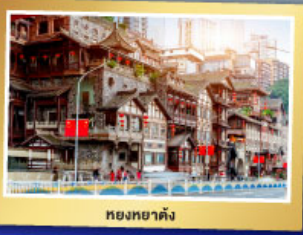
หอยหยาดัง