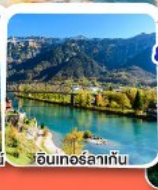
อินเทอร์ลาเก็น