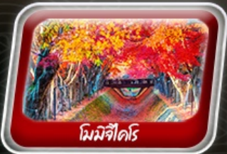
มิยาจิมาดะ

สายการบิน AirAsia X (XJ) น้ำหนักกระเป๋า 20 KG