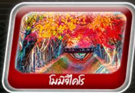
โคมิจิไดริ

สายการบิน AirAsia X (XJ) น้ำหนักกระเป๋า 20 KG