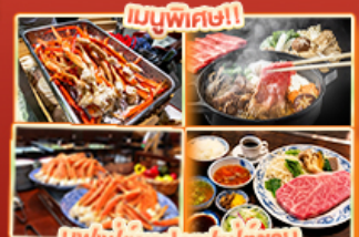
บุฟเฟ่ต์ญี่ปุ่นบุฟเฟ่ต์ญี่ปุ่น ปิ้งย่างยากินิคุในอัน Steakland Kobe