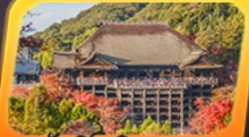
วัดคิโยมิสุเดระ