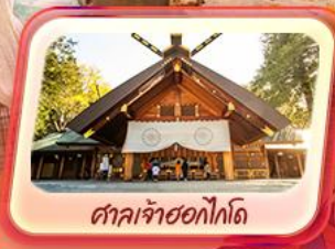
ศาลเจ้าช็อกโกโด้