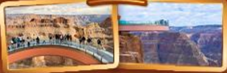
ชมความยิ่งใหญ่ของ GRAND CANYON WEST SKYWALK