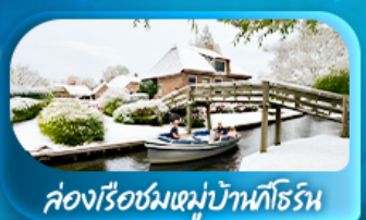
คottage ชมหมู่บ้านโทริช

พิเศษ ล่องเรือแม่น้ำเซน ชมเมือง โดย บาโต มูช