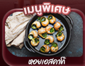
ผอเมสคาโก้

“สัมผัสประสบการณ์สุดพิเศษกับแลนด์มาร์คชื่อดังเมืองปารีส” ชมหอไอเฟล ล่องเรือชมวิวปารีสสองฝั่งแม่น้ำแซน ประตูดัชชอันยิ่งใหญ่ เยือนพระราชวังแวร์ซายส์ อลังการด้วยสถาปัตยกรรมและสวนอันกว้างใหญ่ พิพิธภัณฑลุ่มพร ซุปบิงที่ถนนชองเซลีเซ อีสรະเต็มวันสัมผัสบรรยากาศปารีส