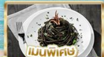
เมนูพิเศษ