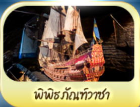
พิพิธภัณฑ์ท้าวชา