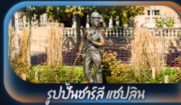
รูปปั้นซาร์ลี แซปลิน