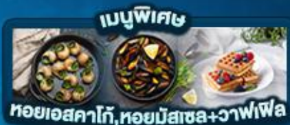
เมนูพิเศษ หอยแอสคาโก้, หอยมัสเซล+วaffle

พิเศษ ล่องเรือแม่น้ำเซน ชมเมือง โดย บาโต มูช