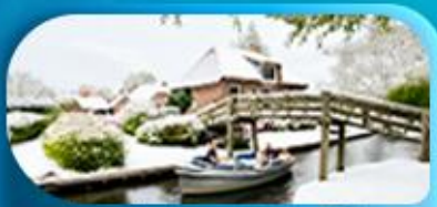
คลองเรือชมหมู่บ้านทีโฮร์น

พิเศษ ล่องเรือแม่น้ำเซน ชมเมือง โดย บาโต มูช