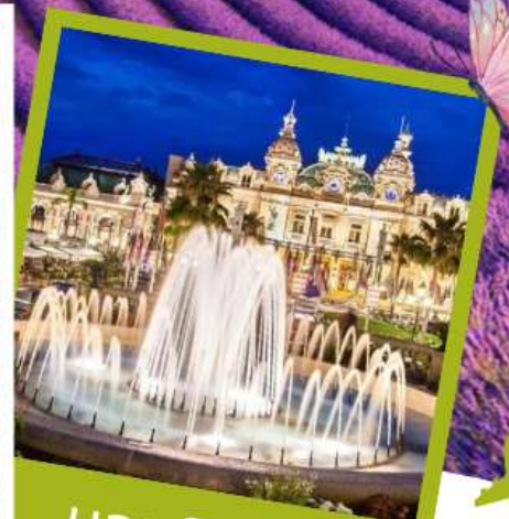
มอนติคาร์โร