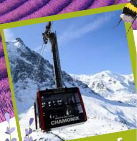
มองค้บลังค์