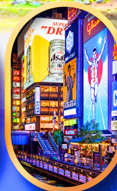
ย่านชินไซบาชิ