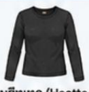
สวมฮีตเทค (Heatech) แบบหนาพิเศษด้านใน