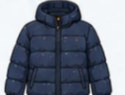
เสื้อขนเป็ด