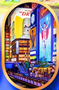
ย่านชินโซบาสึ