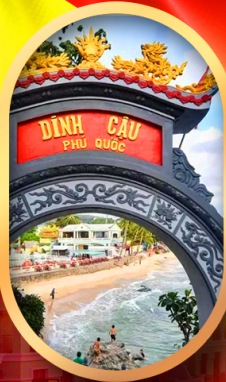
ศาลเจ้าติงเกา