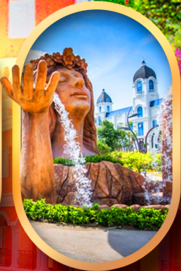
น้ำตกเทพพิหตุยง