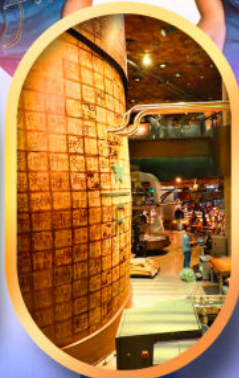
ร้านสตาร์บัคส์