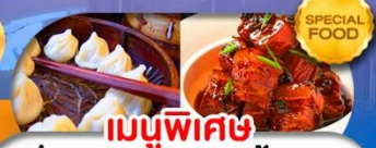
เมนูพิเศษ เสี่ยวหลงเปา หมูน้ำแดง เดินทาง ต.ค. 69 - มี.ค. 70