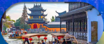
Zhujiajiao Ancient Town ล่องเรือเมืองโบราณ

เซี่ยงไฮ้ ดิสนีย์แลนด์ เมืองโบราณจูเจียเจียว