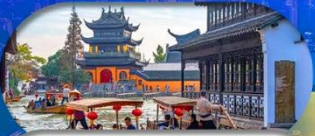
Zhujiajiao Ancient Town ส่องเรือเมืองโบราณ

เชียงใหม่ ดิสนีย์แลนด์ เมืองโบราณจูเจียเจียว