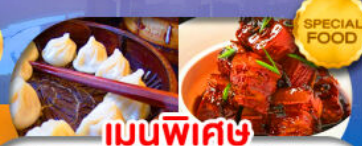
เมนูพิเศษ เสี่ยวหลงเปา หมูน้ำแดง เดินทาง ต.ค. 69 - มี.ค. 70