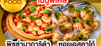
พิซซ่ามาริตต้า หอยแอสคาโก้