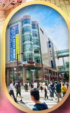
ช้อปปิ้งย่านเท็นจิน