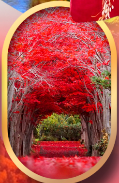
สวนฮิราโอกะ