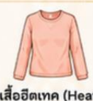
สวมเสื้อฮีทเทค (Heattech) ไร์ดาวน์เพื่อเพิ่มความอบอุ่น แทนการใส่เสื้อหลายๆ หลายชั้น