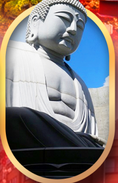
พระใหญ่อะตะมะ