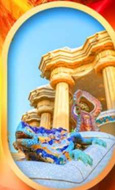
ปาร์ค กูเอล