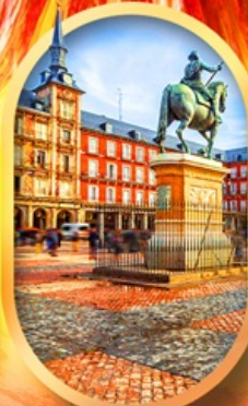
พลาซามายอร์