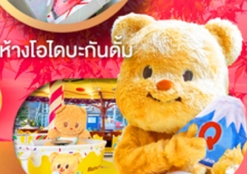
Fuji q Highland x Butterbear เดินทาง พ.ค. 69 เป็นต้นไป