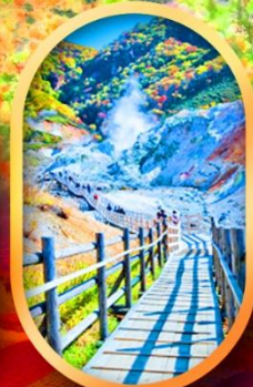
หุบเขานรกจิกโคคาบิ