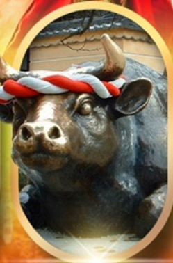
ศาลเจ้าดาไซฟู