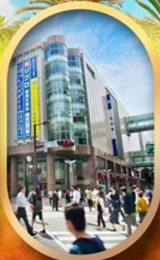
ช้อปปิ้งย่านเท็นจิน