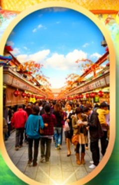
ถนนนากามิเสะ