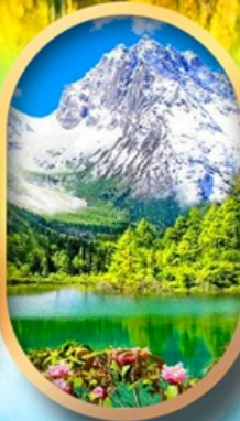
อุทยานบิฝิงโกว