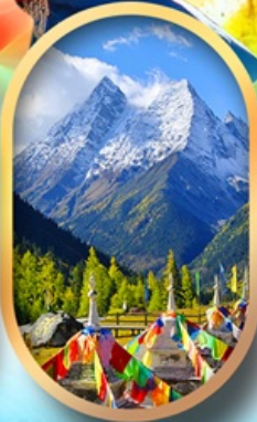
อุทยานสี่ครุณี