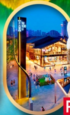
ถนนคนเดินไท่กู่หลี่