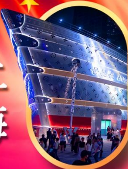
เรืออะทลันติก