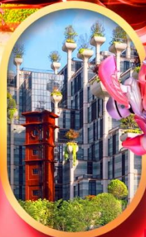
อาคารพินตันโบ