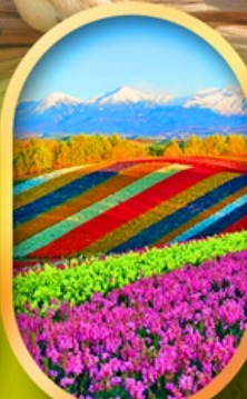
สวนดอกไม้ชิชิโซ