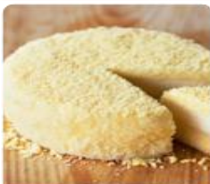
ร้าน LeTAO ร้านผลิตเค้กอร่อย ด้วยรสชาติในร้านหลากหลายใช้ไข่ที่ผสมอุณหภูมิสูงด้วยเพลงสากลแบบอิตาลี