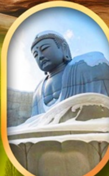
เนินเขาแห่งพระพุทธรเจ้า