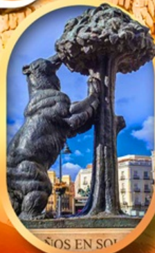
อนุสาวรีย์หมี