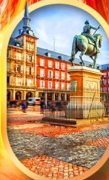
พลาซามายอร์