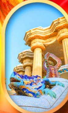
ปาร์ค กูเอล