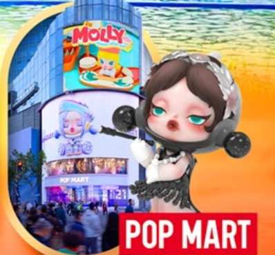
ถนนหนานจิง