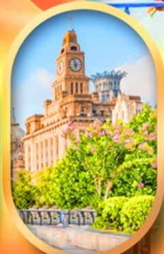
หาดไว่ทานเดอะบันด์