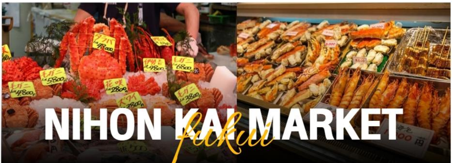
NIHON KAI MARKET

นำทุกท่านเดินทางสู่ ตลาดปลานิสงไค เป็นสถานที่ที่มีชื่อเสียงในการค้าปลาและอาหารทะเลสดใหม่ มีหลากหลายชนิดของปลาและอาหารทะเลที่ถูกจับมาจากทะเลญี่ปุ่น บรรยากาศที่ตลาดเต็มไปด้วยความคึกคักของผู้คนที่มาซื้อของและนักท่องเที่ยวที่มาเยี่ยมชม คุณสามารถพบกับร้านค้าที่ขายปลาสด ซูชิ และชาชิมิที่ทำจากวัตถุดิบที่ดีที่สุด อีกทั้งยังมีร้านอาหารที่เสิร์ฟอาหารทะเลแสนอร่อยให้คุณได้ลิ้มลอง