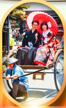
เมืองเก่าทาคายามา