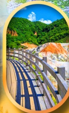
โนโบริเบทสึ