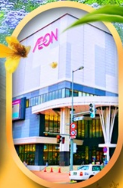
อ็อนมอลล์