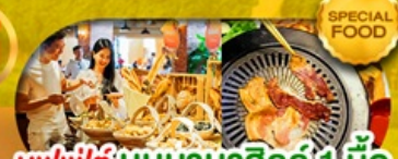
บุฟเฟ่ต์ บันบานาฮิลล์ 1 มื้อ และ บุฟเฟ่ต์ บาบิวบิงย่าง เดินทาง มี.ค. - ต.ค. 69