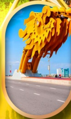
สะพานมังกรดาบิง