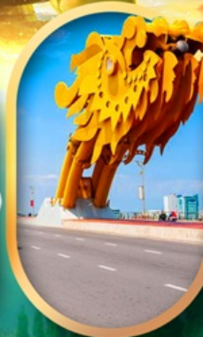
สะพานมังกรดานัง