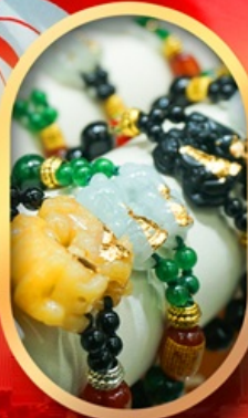
ร้านหยกอัญมณี