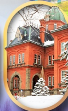
ศาลาว่าการฮอกไกโด