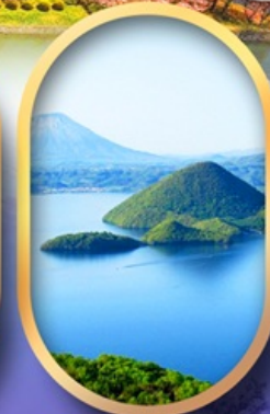
วิวทะเลสาบโทโยะ