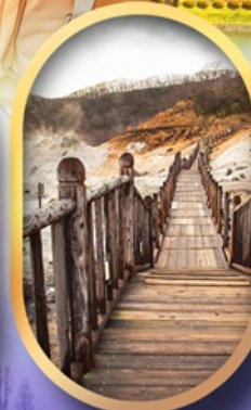
หุบเขาจิกุกดาบิ