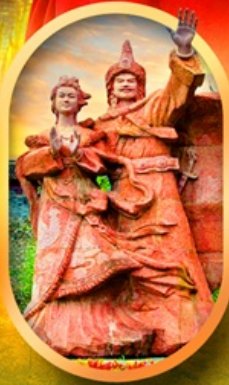
เมืองโบราณชางพาน